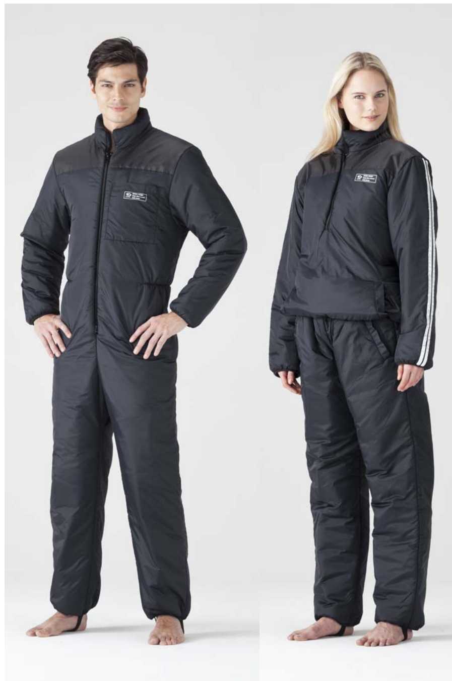
ワンピースタイプ

ボディ・ヒート・ガードは、ファブリックドライスーツ専用に開発。対スクイズに負けない「3M™シンサレート™」を使用して、保温性と運動性を両立させた機能インナースーツです。